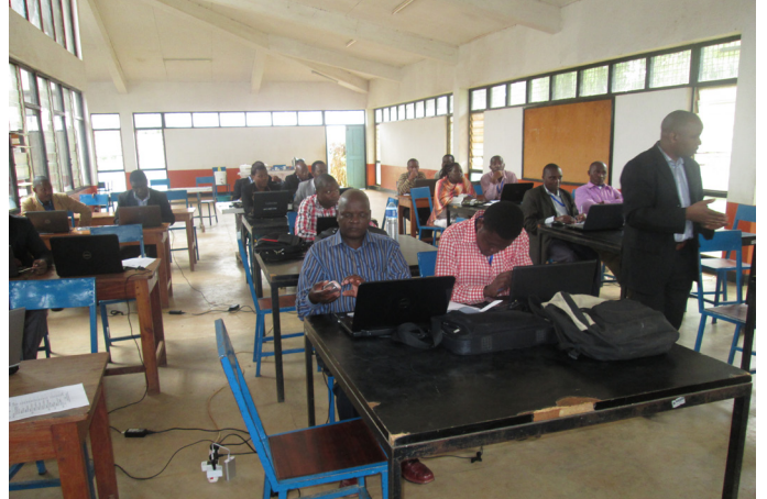
Wataalamu wa Halmashauri ya Wilaya ya Njombe wakiwa katika mafunzo ya kuandaa mpango mkakati wa Halmashauri katika shule ya sekondari Njombe.