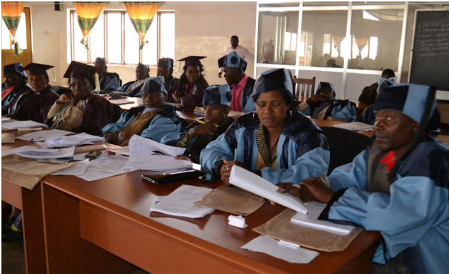
Madiwani wa Halmshauri ya wilaya ya Njombe wakiwa katika kikao cha baraza la madiwani baada ya kuzinduliwa kwa baraza hilo.

Aidha, ili kuhakikisha madiwani wanatekeleza wajibu wao kwa uhakika, walipewa mafunzo ya kuwajengea uwezo. Mafunzo hayo yalijikita kuwapa uwezo wa kutekeleza vizuri wajibu wao. Mafunzo hayo yalihusu Wajibu wa madiwani katika Halmashauri, Dhana ya utawala bora, Kanuni za kudumu za Halmashauri pamoja na ujazaji wa tamko la viongozi wa umma kuhusu mali na madeni.