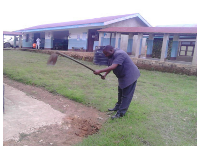
Mkurugenzi mtendaji wa Halmashauri ya Njombe (sasa Kasuru) akikwatua uwanja ikiwa ni sehemu ya maadhimisho ya siku ya Uhuru