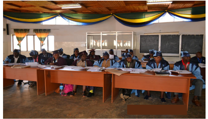
Madiwani wa Halmashauri ya wilaya ya Njombe wakifuatilia kwa makini uwasilishwaji wa makisio ya bajeti kwa mwaka wa fedha 2016/2017.