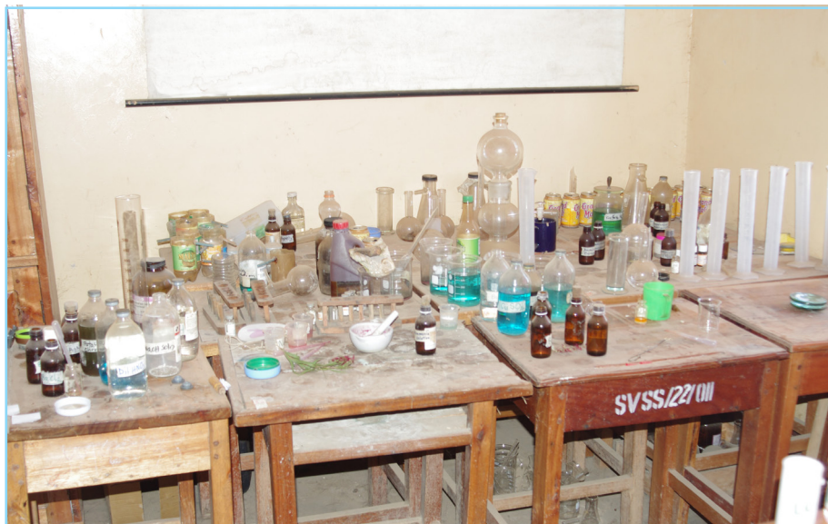
Vifaa vya maabara katika shule ya Sekondari Sovi Kata ya Mtwango wilayani Njombe vinawawezesha wanafunzi kujifunza kwa vitendo.

Vifaa vya kujifunzia vikiwemo daftari na kalamu, Chakula kwa